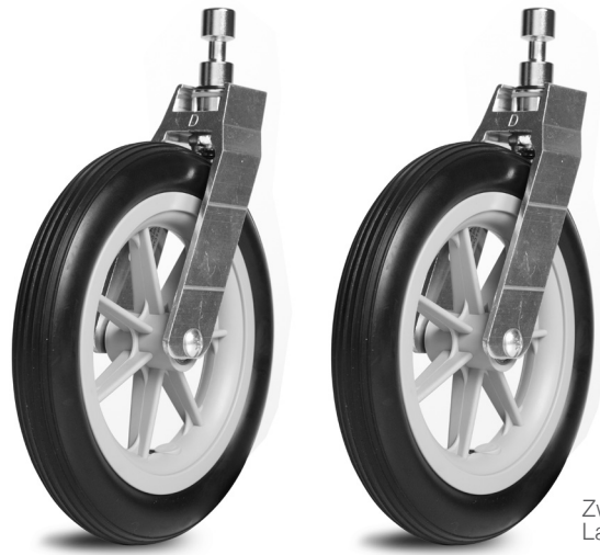
Zwei lenkbare Laufräder